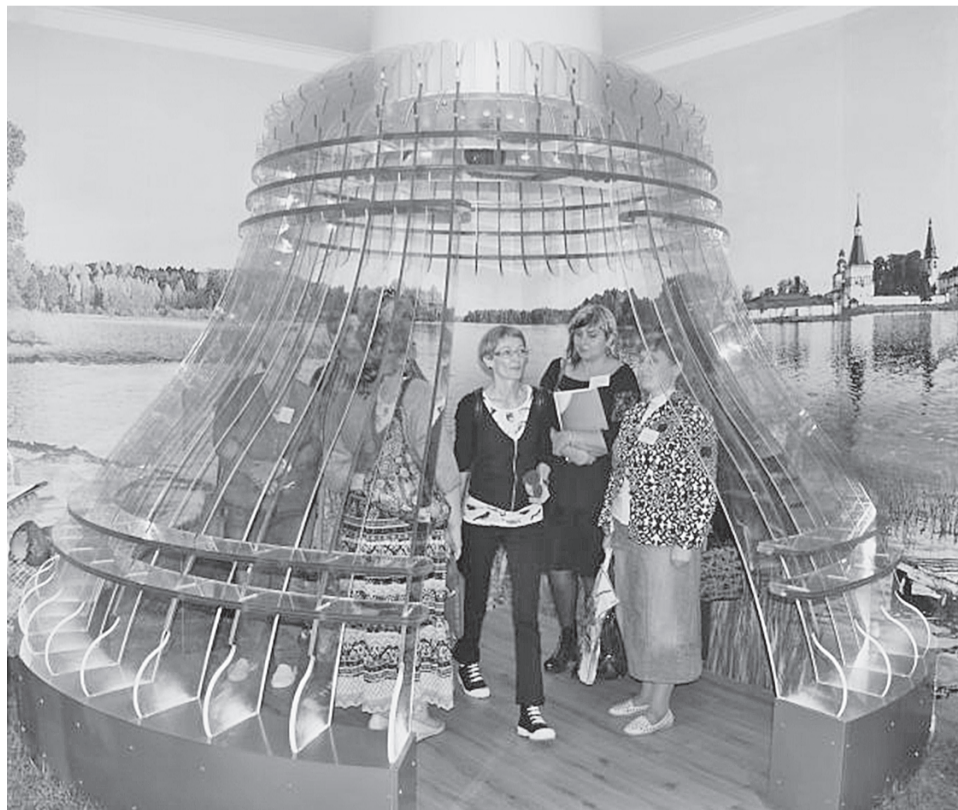
И зазвучали колокольные звоны Святого озера...

ный город: здесь работают крытый ледовый дворец, новый универсальный спортивный центр. В скором времени на берегу Валдайского озера в черте города откроется Молодежный культурно-досуговый центр. Наш сосед гостеприимно приглашает боровичан к себе в гости, ведь впереди у детей школьные каникулы!