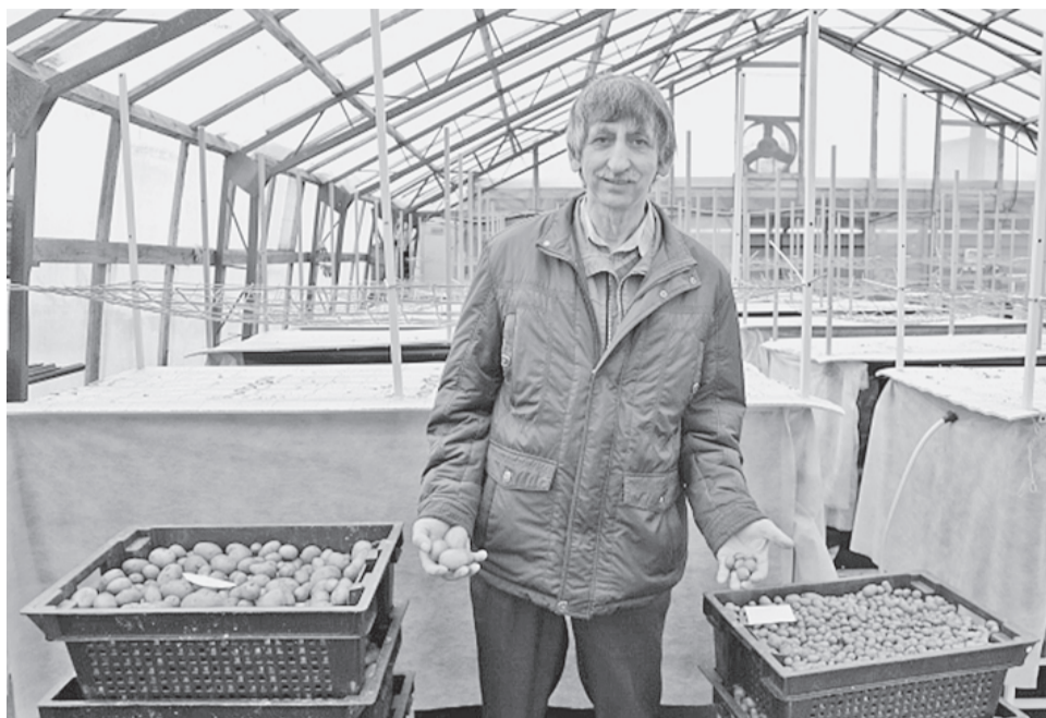
Мини-клубни картофеля, выращенные беспочвенным методом (справа) не больше клубники